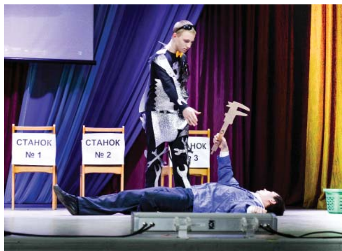
Созданный командой «Неформат» робот со сверхвозможностями «Агрегатор» приходит на помощь уставшему наладчику станков