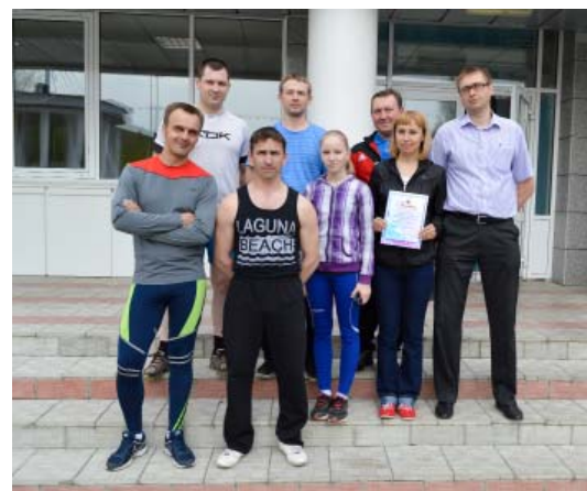
Команда цеха 51

Хочется сказать «спасибо» всем участникам за то, что вышли на старт