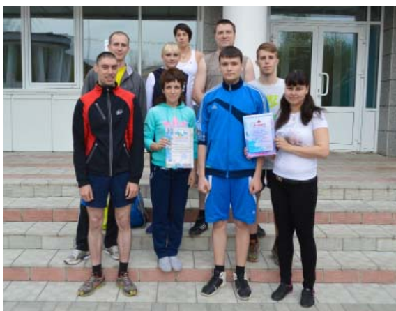
Команда 16 отдела

Среди коллективов ОАО «Агрегат» победителем стала команда 16 отдела, второе место занял 51 цех и третье – 46 цех.