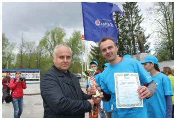
Вручение кубка команде «Агрегат»

14 мая 2017 года команда ПАО «Агрегат» приняла участие в районной легкоатлетической эстафете, посвященной Дню Победы в Великой Отечественной войне, которая ежегодно проходит в Аше.