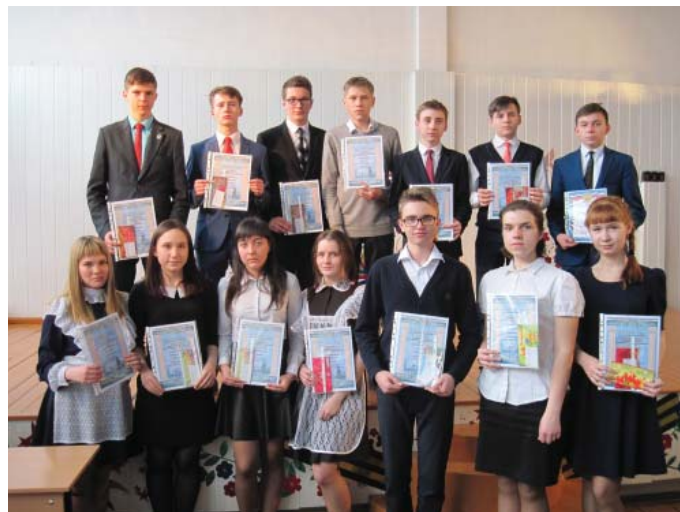
Победители и призеры олимпиад