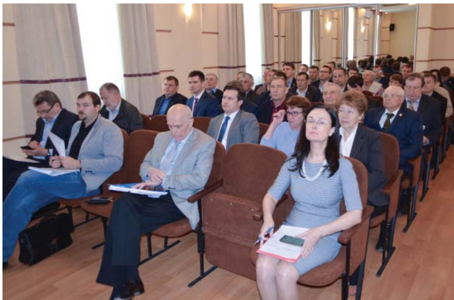
Участники собрания акционеров

Общая численность работников – 2 558 человек, из них мужчин 52%, женщин 48%. Основных рабочих –