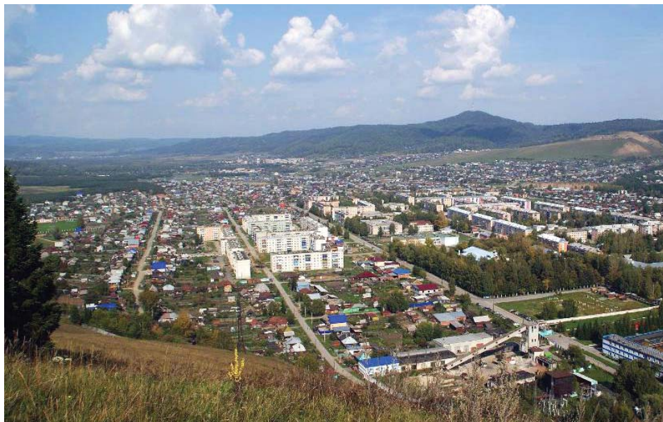
Вид с Доменной горы на западную часть города

В предыдущих номерах газеты «Агрегат» была рассказана история центральных улиц города и микрорайонов: Клевер, Гумны, Верхняя зона и других. О названиях улиц западной части города и станции Симской – в завершающей части цикла статей.