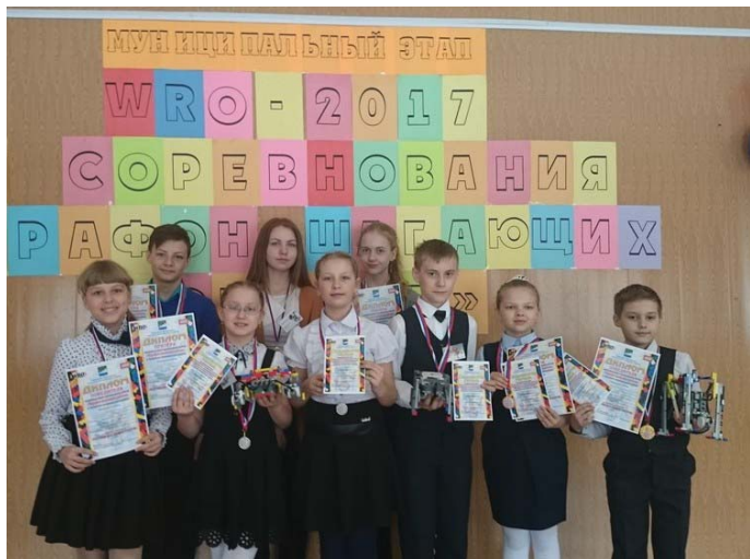
Марафон шагающих роботов

Школа – это мир, отражающий в себе время. Школа №2 города Сим – это не только современный интерьер, но и, в первую очередь, учителя, шагающие в ногу со временем: талантливые, творческие, активные.