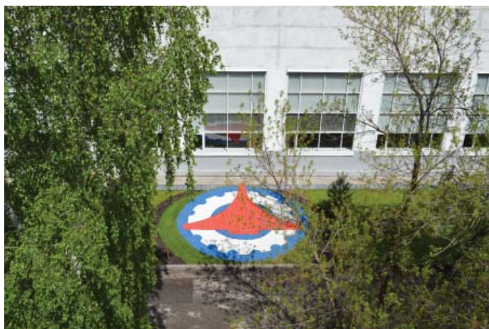
Эмблема «Агрегата» из декоративного цветного щебня диаметром 7,5 метров

Ежегодный конкурс на лучшее оформление и содержание закрепленной территории объявлен и в мае 2017 года. Победители в каждой группе цехов и отделов будут определены осенью и награждены премиями.