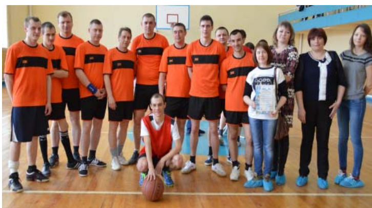
Баскетболисты 46 цеха

11 апреля завершились соревнования по баскетболу в зачет Спартакиады ОАО «Агрегат». Как и в прошлом году, в них приняли участие мужские и женские команды. В результате упорной борьбы в тройке лучших у мужчин I место - 46 цех,