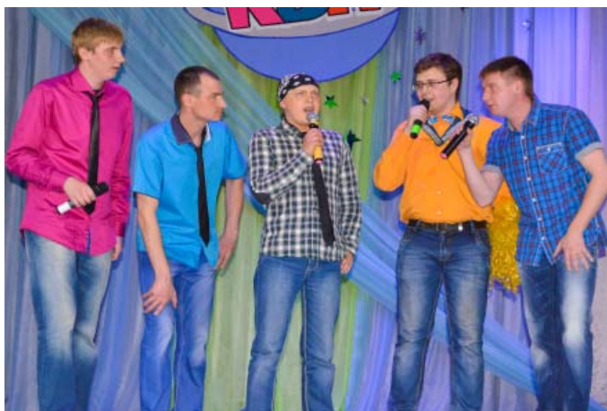
Команда КВН «Такие молодые»

Участники смогли показать свои творческие способности в «Разминке», «Танцевальной революции», «Конкурсе капитанов». Зрителям запомнились некоторые удачные высказывания: